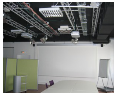
Vue du plateau technique

Grâce à une veille technologique soutenue, la plate-forme est en constante évolution.